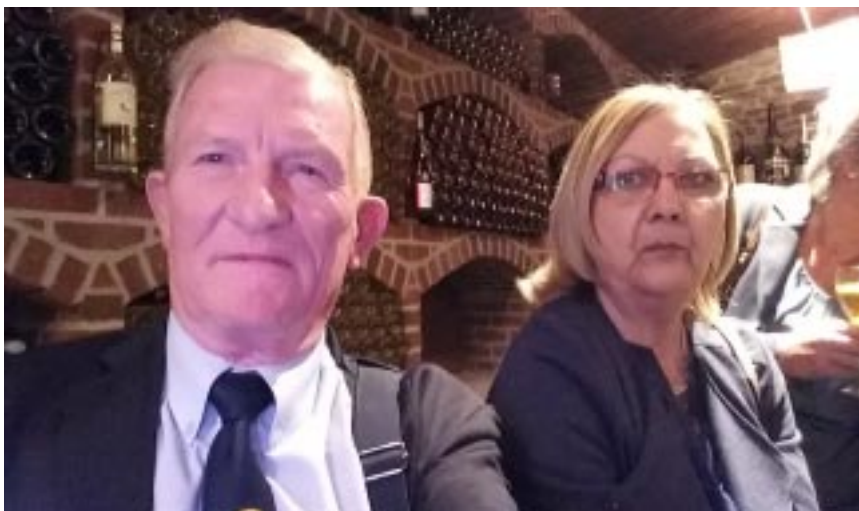
Tot slot een groepsfoto van de Limburgse delegatie tijdens het Nationaal Congres te Rochehaut (Prov Luxemburg)

***Je kan nog steeds kiezen voor een digitale versie van dit boekje. Het bespaart ons verzendingskosten. Je kan dit doen door een mailtje te sturen naar de redactie : fransvanoppen@outlook.com waarbij u vraagt om de digitale versie te ontvangen. U krijgt dan steeds tijdig het boekje en in kleur.